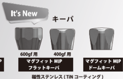
マグフィット MIP フラットキーパ 磁性ステンレス (TIN コーティング)