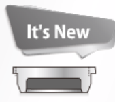
フラットタイプ 吸引力 600gf